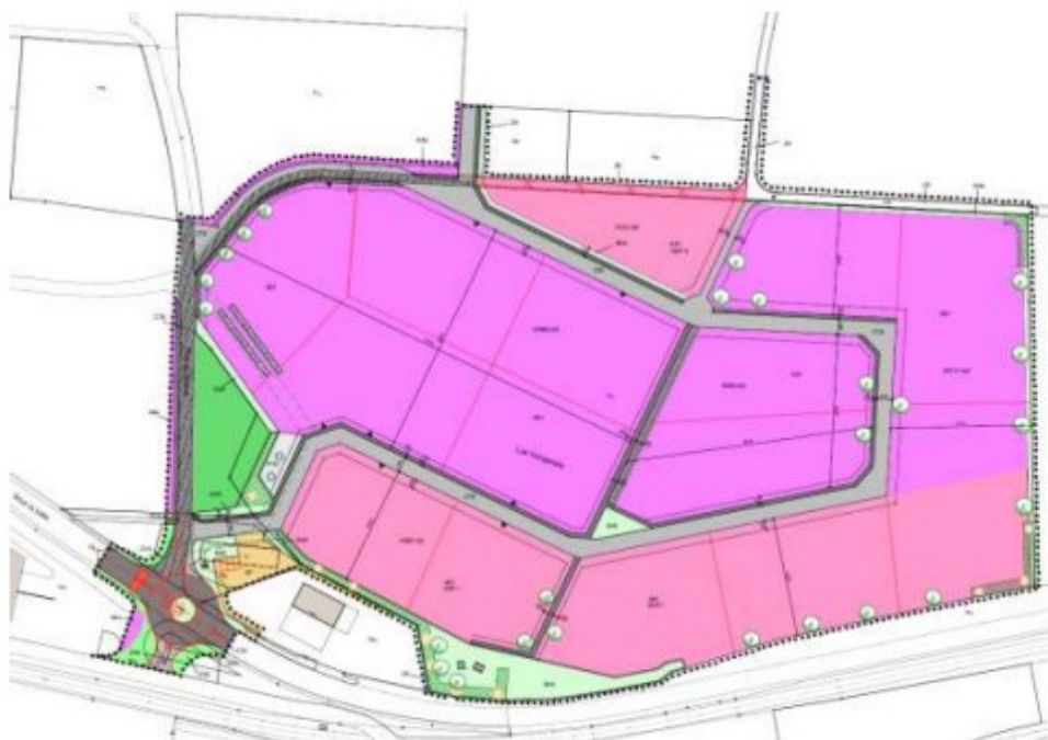
Extrait du plan spécial régional en cours d'étude