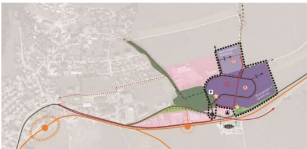
Extrait du plan directeur régional de la zone AIC du Noirmont approuvé le 15 avril 2021